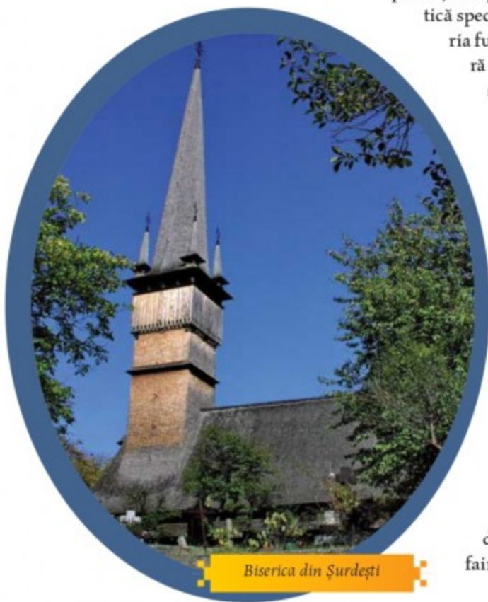
Biserica din Șurdești

„Se știe că (în Maramureș) se găsesc unele dintre cele mai interesante construcții religioase din lume; nu numai din țara noastră, ci din întreaga Europă. Bisericile de lemn maramureșene și-au câștigat demult faima bine-meritată atât în rândul specialiștilor